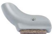
Filzgleiter Attivo-Swing "hinten rechts"