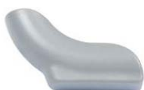
Gleiter Attivo-Swing "hinten links"