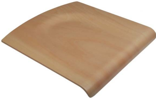
Sitz für Schülerstuhl 3603/4603 ungebohrt