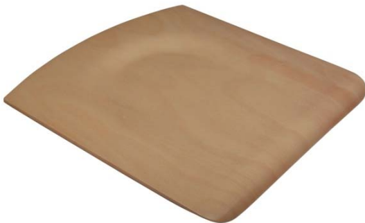
Sitz für Schülerstuhl 3613/4613 ungebohrt