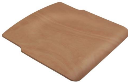
Sitz für Schülerstuhl 4309 Gr.2-3-4 mit seitlicher Ausfräsung, ungebohrt