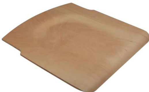
Sitz für Schülerstuhl 4309 Gr.4-5-6 mit seitlicher Ausfräsung, ungebohrt