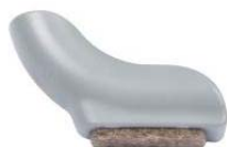
Filzgleiter Attivo-Swing "hinten links"