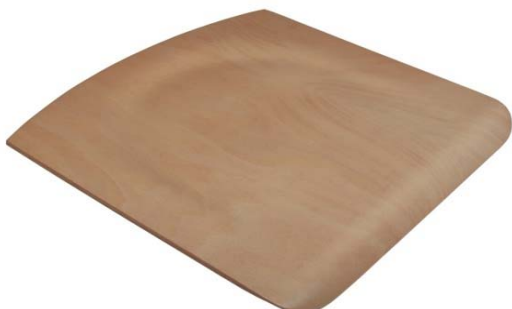
Sitz für Schülerstuhl 4305 ungebohrt