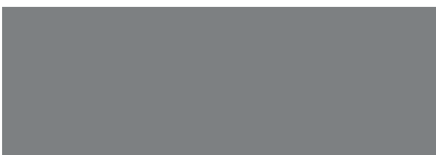
RAL 7037 Staubgrau